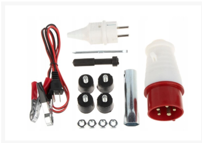
Agregat Prądowórczy 3000W 7KM Trójfazowy Przenośny