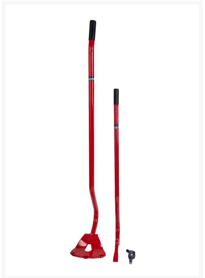
Ręczna montażownica INVENTO do demontażu opon ciężarowych 22,5-24,5"