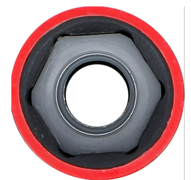
Nasadka udarowa 1/2" do felg aluminiowych BGS do TESLA