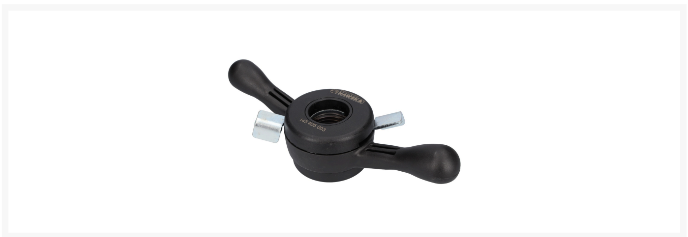
Haweka ProGrip Tr 40 x 4 mm.