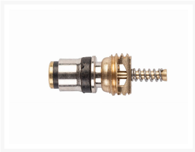
Zestaw zaworków do klimatyzacji - 100 szt.